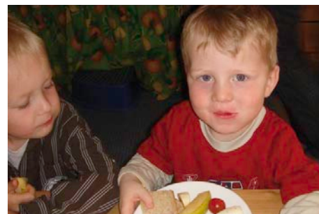
Kinder lernen mit der Tauschbrotzeit zu tauschen und zu teilen.

Der integrative Erdkindergarten in Lohkirchen praktiziert die „Tauschbrotzeit“. Einmal in der Woche legen die Kinder des Kindergartens am Morgen den Inhalt ihrer Brotzeitdosen auf die vorbereiteten Teller. Jedes Kind darf sich im Laufe des Tages das nehmen, was es gerne essen möchte.