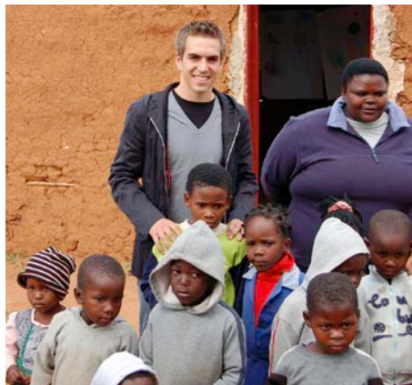
Philipp Lahm vor Ort bei dem Kinderhilfsprojekt seiner Stiftung.

Können Sie sich an einen Vorfall aus Ihrer Schulzeit erinnern, bei dem Sie oder eine andere Person respektlos behandelt wurden? Wie war die Situation und wie haben Sie sich verhalten?