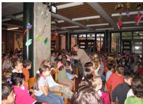
Reflexion eines Rollenspiels in der Schulversammlung.

Die Grundschule an der Rennertstraße in München verbessert seit einigen Jahren im Rahmen ihrer professionellen Schulentwicklung ihre Werteerziehung und beeinflusst so gemeinsam mit den Kindern auf demokratische Weise das alltägliche Schulleben. Alle Achtung wirft einen Blick auf das Projekt der Grundschule „Miteinander elefantenstark“ und seine Methoden und Instrumente in der alltäglichen Arbeit.