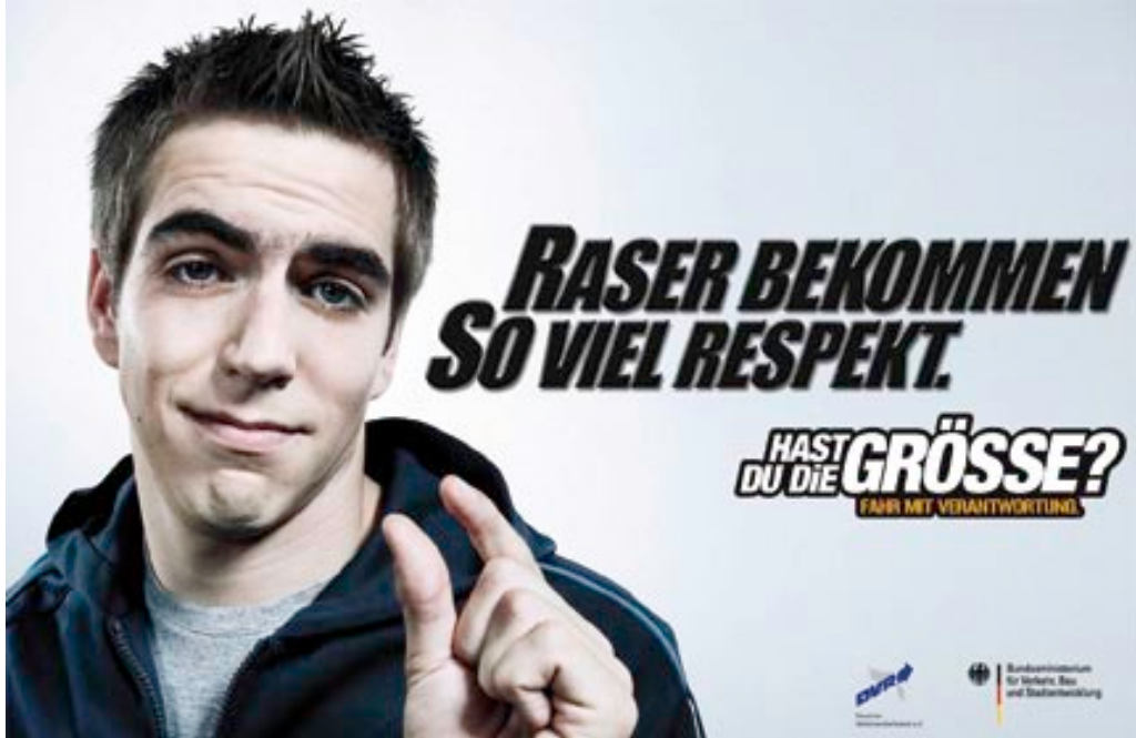
Philipp Lahm unterstützt den Deutschen Verkehrssicherheitsrat gegen Raserei auf Autobahnen.

Werteerziehung und Persönlichkeitsbildung von Kindern zu eigen machen. Was würden Sie Lehrern und Erziehern ans Herz legen?